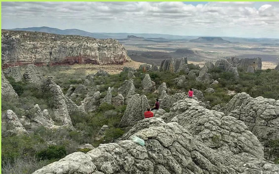
O Vale do Catimbau, em Pernambuco, um dos cenários da novela.

Isso nos leva a tentar entender porque o Sertão é lugar tão paradigmático na identidade brasileira. Nessa trilha, assumimos vinculação ao pensamento de Boaventura de Sousa Santos (2004), assente na Sociologia das Ausências, pela qual enxerga-se o território sertanejo como exemplo claro da “linha abissal” indicada pelo sociólogo português, ou seja, uma zona de tal modo relegada do mundo eurocêntrico, colonial, branco e patriarcal que vive excluída dos grandes planos políticos mundiais, sendo seus habitantes e suas problemáticas quase invisíveis.